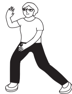
ΤΑΙ ΤΣΙ (TAI CHI)

Αντιμετωπίστε την πρόκληση, δεν πειράζει αν παραπατήσετε αρκεί να έχετε υποστήριξη!