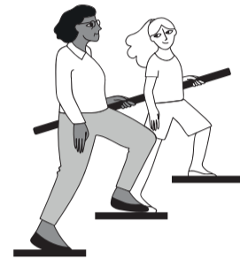
ΠΗΓΑΙΝΕΤΕ ΑΠΟ ΤΙΣ ΣΚΑΛΕΣ

Οι πτώσεις μπορεί να μειωθούν έως και κατά 40% με τις ασκήσεις δύναμης και ισορροπίας.