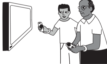
ΒΙΝΤΕΟΠΑΙΧΝΙΔΙΑ ΜΕ ΑΣΚΗΣΗ